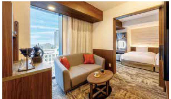
エグゼクティブフロア デラックスツイン