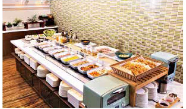
朝食イメージ(ビュッフェ形式)

東京千代田区神田佐久間町1-8-3 JR・つくばエクスプレス秋葉原駅より約1分 東京メトロ秋葉原駅より徒歩約2分 都営新宿線岩本町駅より徒歩約3分 ☎03-3255-3311