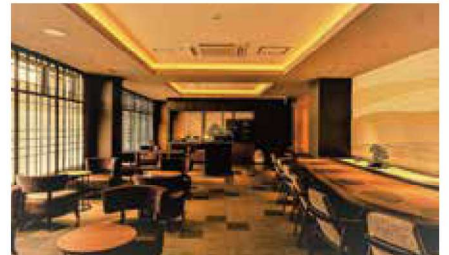
Premium Lounge(プレミアムラウンジ)