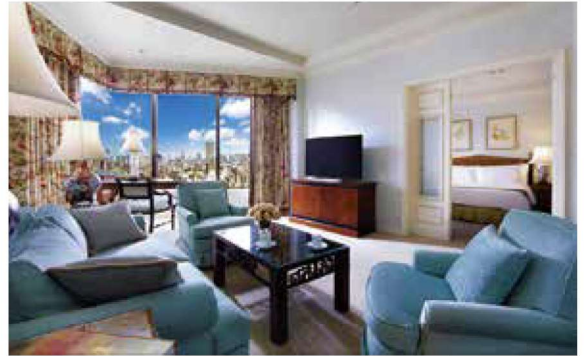
プライムエグゼクティブスイート シティビュー