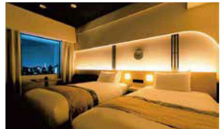
プレミアムツインルーム(高層階確約)